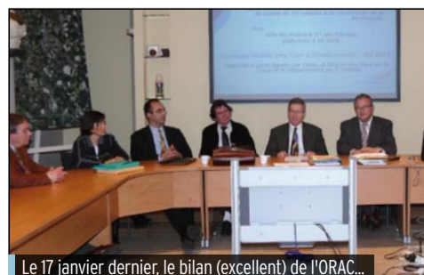
Le 17 janvier dernier, le bilan (excellent) de l'ORAC...

Syndicat Mixte du Pays Yon et Vie Tél. 02 51 06 98 77