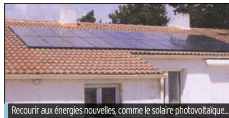
Recourir aux énergies nouvelles, comme le solaire photovoltaïque...