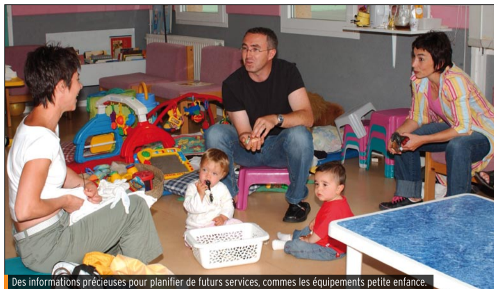
Des informations précieuses pour planifier de futurs services, comme les équipements petite enfance.

collation et le croisement de données disponibles ont permis de dégager des grandes tendances. Les taux d'accroissement annuels moyens vont de 0,4 à 3,5 %, soit une excellente dynamique. Dans le courant du premier semestre 2009, le Pays et les communes qui le composent devraient connaître précisément leurs poids et évolutions démographiques : des éléments d'information précieux pour planifier de futurs services et équipements pour les personnes et autres programmes de construction de logements !"