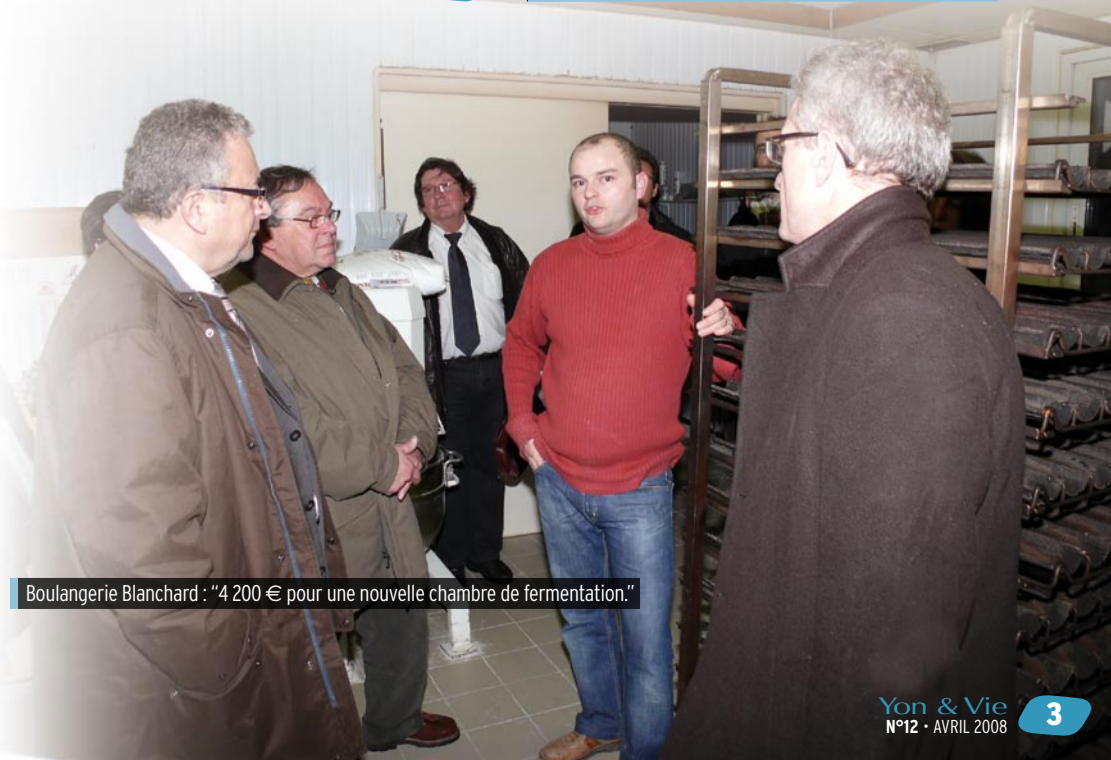
Boulangerie Blanchard : "4 200 € pour une nouvelle chambre de fermentation."