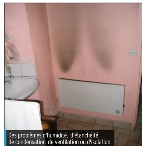
Des problèmes d'humidité, d'étanchéité, de condensation, de ventilation ou d'isolation.

Les objectifs concernent la réalisation de 50 diagnostics et l'amélioration de 15 logements, pour lesquels des aides financières seront réservées par l'ANAH (Agence Nationale de l'Habitat) et par les deux Communautés de Communes du Pays, dans le cadre des Opérations Programmées d'Amélioration de l'Habitat en cours sur le territoire. Techniquement parlant, ce sont surtout des problèmes d'humidité, d'étanchéité, de condensation, de ventilation ou d'isolation qui affectent le confort et la santé des occupants. De même, la sécurité dans le logement peut être mise en cause par un dysfonctionnement du circuit électrique, des appareils de chauffage générant un taux élevé de monoxyde de carbone ou une présence d'amiante ou de plomb. Autant d'aspects qui seront identifiés en phase de diagnostic et qui pourront faire l'objet de travaux d'amélioration.