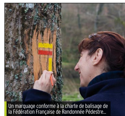
Un marquage conforme à la charte de balisage de la Fédération Française de Randonnée Pédestre...