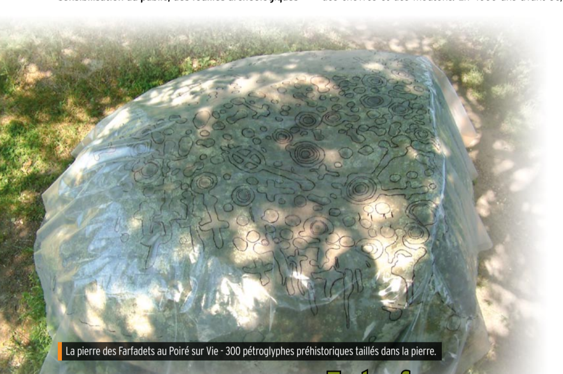
La pierre des Farfadets au Poiré sur Vie - 300 pétroglyphes préhistoriques taillés dans la pierre.

ERA - Laboratoire d'Archéologie Z.A. Les Petites Guigeries 85320 La Bretonnière-La-Claye Tél. 06 08 96 82 51 ou 06 87 03 46 45 Email : contact@erarcheo.com Site web : www.erarcheo.com