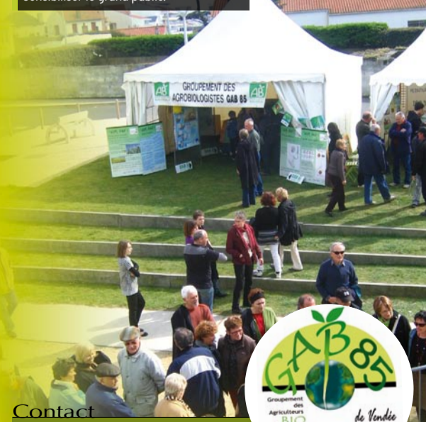
Le stand du GAB85 à Saint-Hilaire-de-Riez. Sensibiliser le grand public.

étant très demandeuse, nous souhaitons conforter le mouvement, à l'appui de réunions d'information pour les établissements, de diagnostics de leurs besoins et de mise en relation avec des producteurs bio locaux. Des visites et échanges d'expériences entre producteurs et cuisiniers ou gestionnaires, la formation des cuisiniers à la cuisine de produits bios et à l'équilibre budgétaire, l'accompagnement dans le cadre des marchés publics, ... sont aussi à mener". Encore à la marge (moins de 3% de la surface agricole du département lui est consacré), le bio progresse pourtant significativement. En attestent le boom des demandes de formations spécialisées, les 40 conversions et la dizaine d'installations d'exploitations en 2009, la création en cours d'un atelier de transformation de légume spécialisé en bio.... Beaucoup reste à faire : densifier et organiser l'offre, faciliter l'insertion des nouveaux installés ou "convertis", libérer du foncier pour le maraîchage périurbain, obtenir l'appui des collectivités, sans négliger la nécessaire sensibilisation des consommateurs... "Mais la croissance du bio semble inéluctable, tirée par de plus en plus de consommateurs en attente forte de produits bio respectueux de l'environnement et de bonne qualité alimentaire, et dont beaucoup cherchent à relocaliser leurs achats sur les producteurs de proximité."