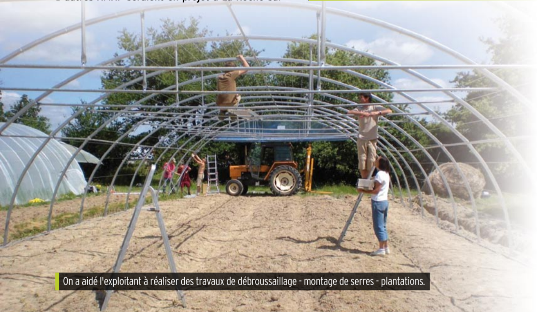
On a aidé l'exploitant à réaliser des travaux de débroussaillage - montage de serres - plantations.

Groupement des Agriculteurs Bio de Vendée