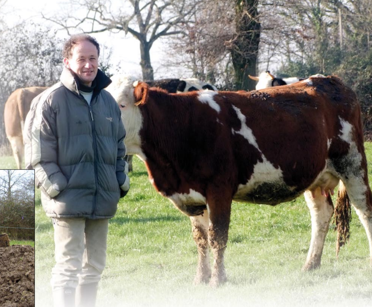
65 vaches allaitantes sur l'exploitation convertie au bio depuis 1999.

Blog : amapdupaysdemontaigu.over-blog.com Courriel : amapdupaysdemontaigu@yahoo.fr Tél. : 06 87 54 76 60