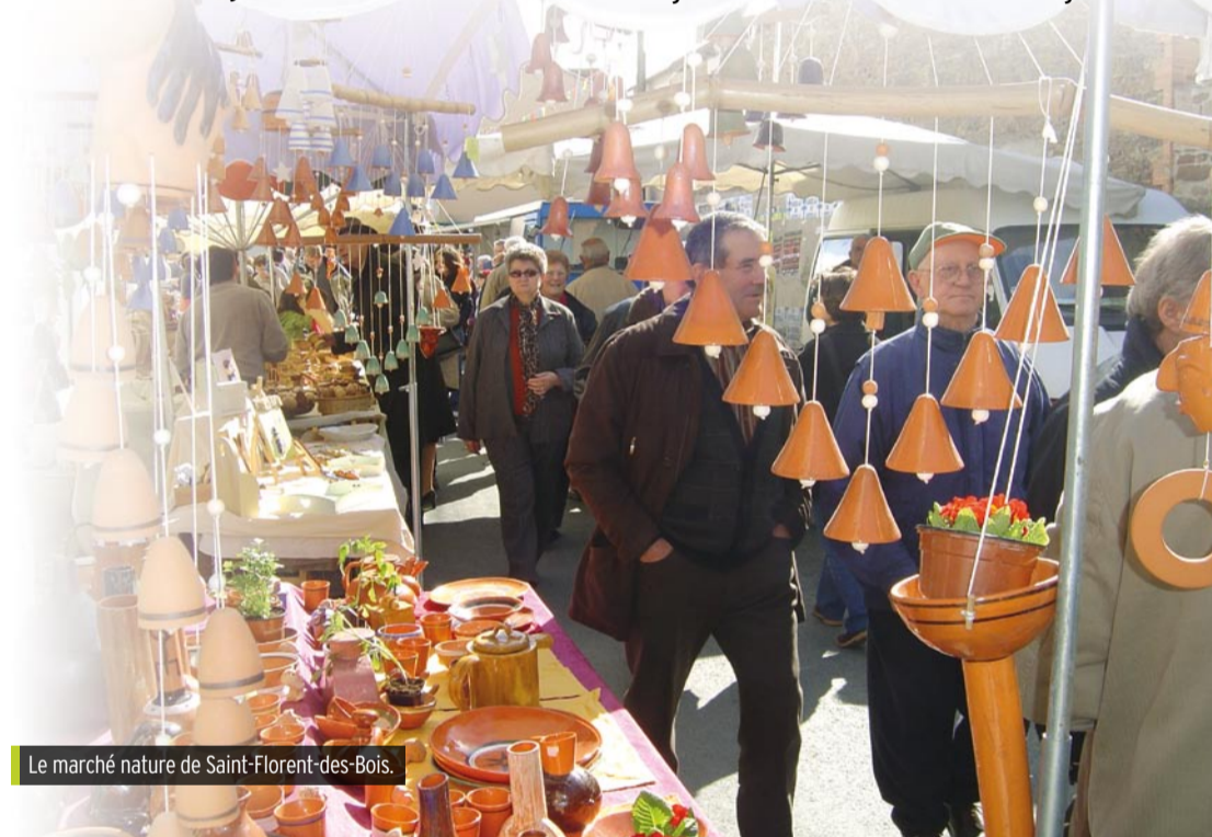
Le marché nature de Saint-Florent-des-Bois.