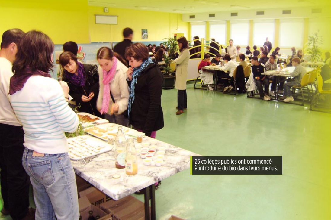
25 collèges publics ont commencé à introduire du bio dans leurs menus.

GAB85 Groupement d'Agriculteurs Biologiques de Vendée 13, rue de la République - boîte aux lettres n°85 85000 LA ROCHE SUR YON Tél. : 02 51 05 33 38 - Fax : 02 51 05 30 42 Email : accueil@gab85.org Web : http://gab85.free.fr