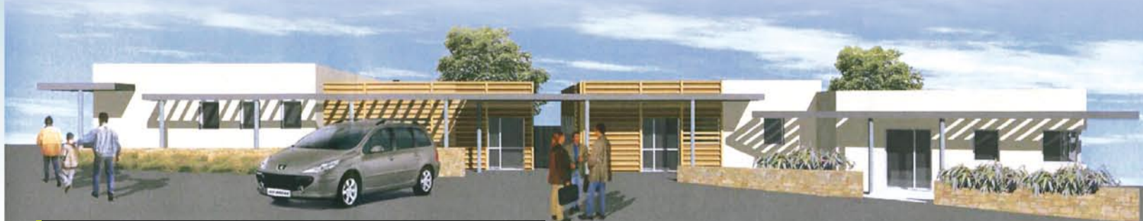
La Maison de santé pluridisciplinaire à Aubigny - 476 m 2 pour une dizaine de professionnels.