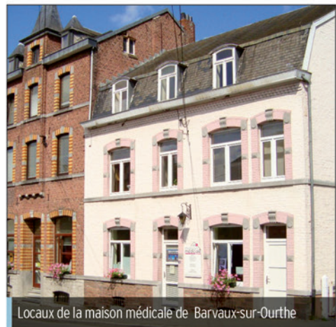
Locaux de la maison médicale de Barvaux-sur-Ourthe

* Le paiement au forfait se décide sur la base d'un contrat entre le patient, la maison médicale et la mutualité. Cette dernière verse chaque mois le forfait à la Maison médicale, laquelle s'engage à soigner le patient et à le rencontrer autant de fois qu'il le faudra.