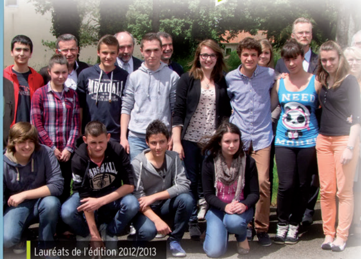
Lauréats de l'édition 2012/2013